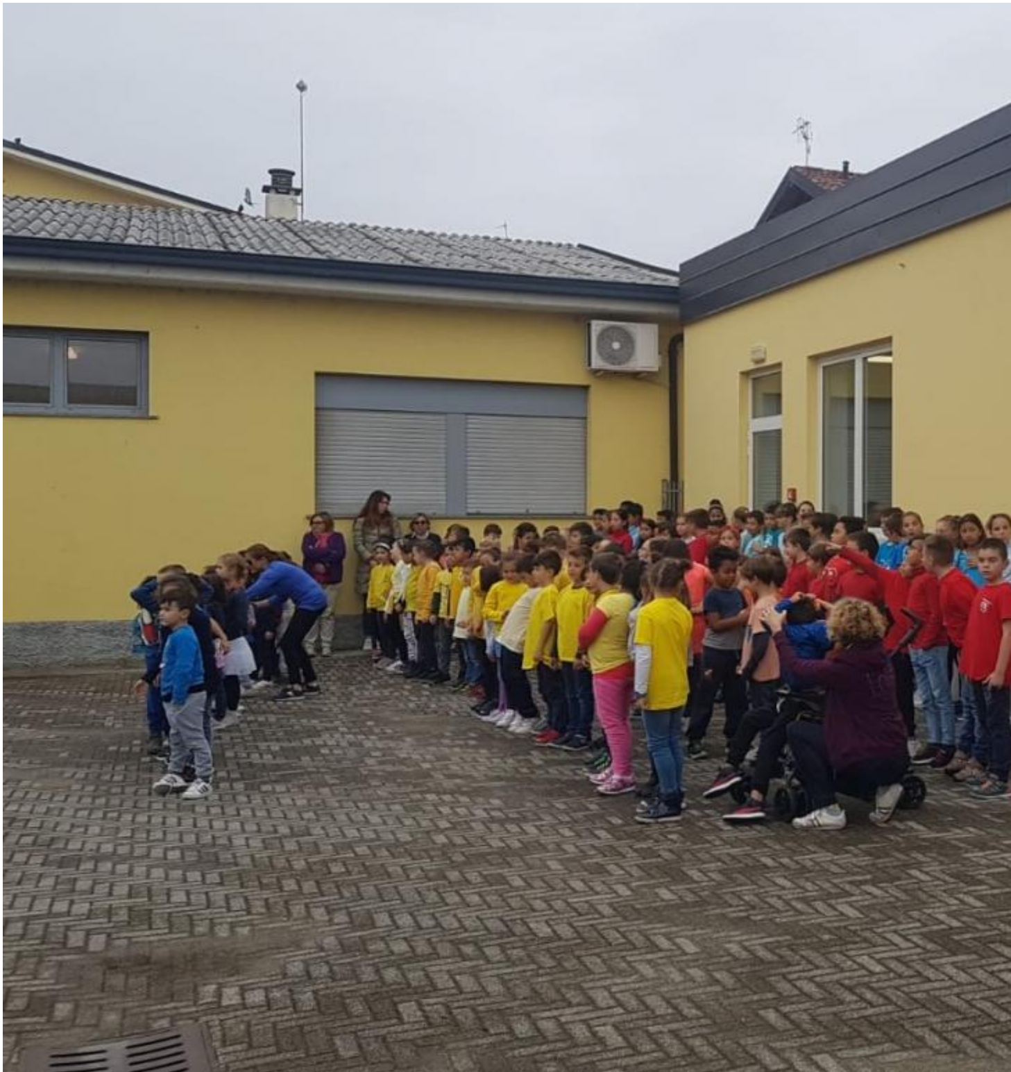
Commemorazione del 4 Novembre 2022