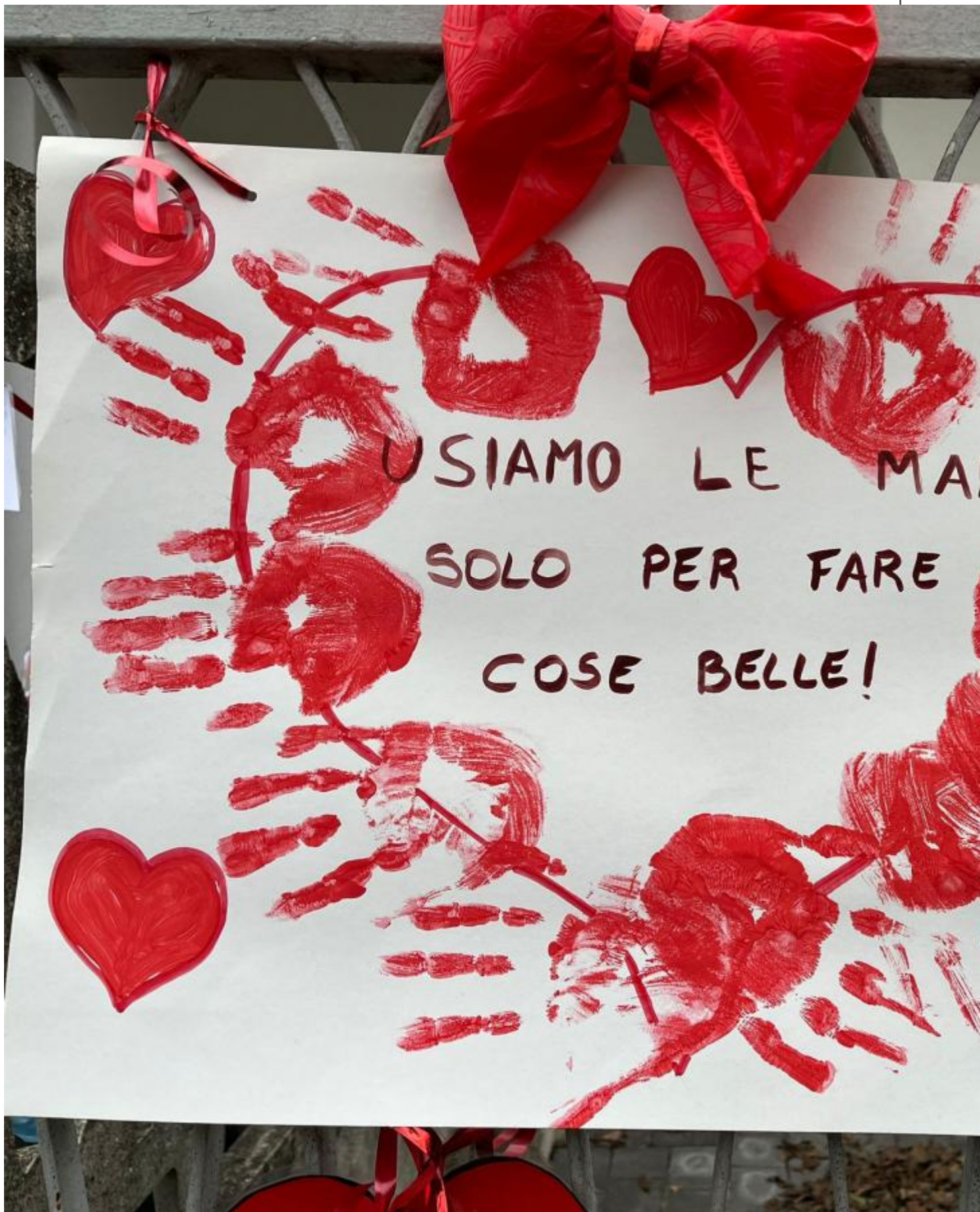
In occasione della Giornata Internazionale per l'eliminazione della violenza contro le donne,